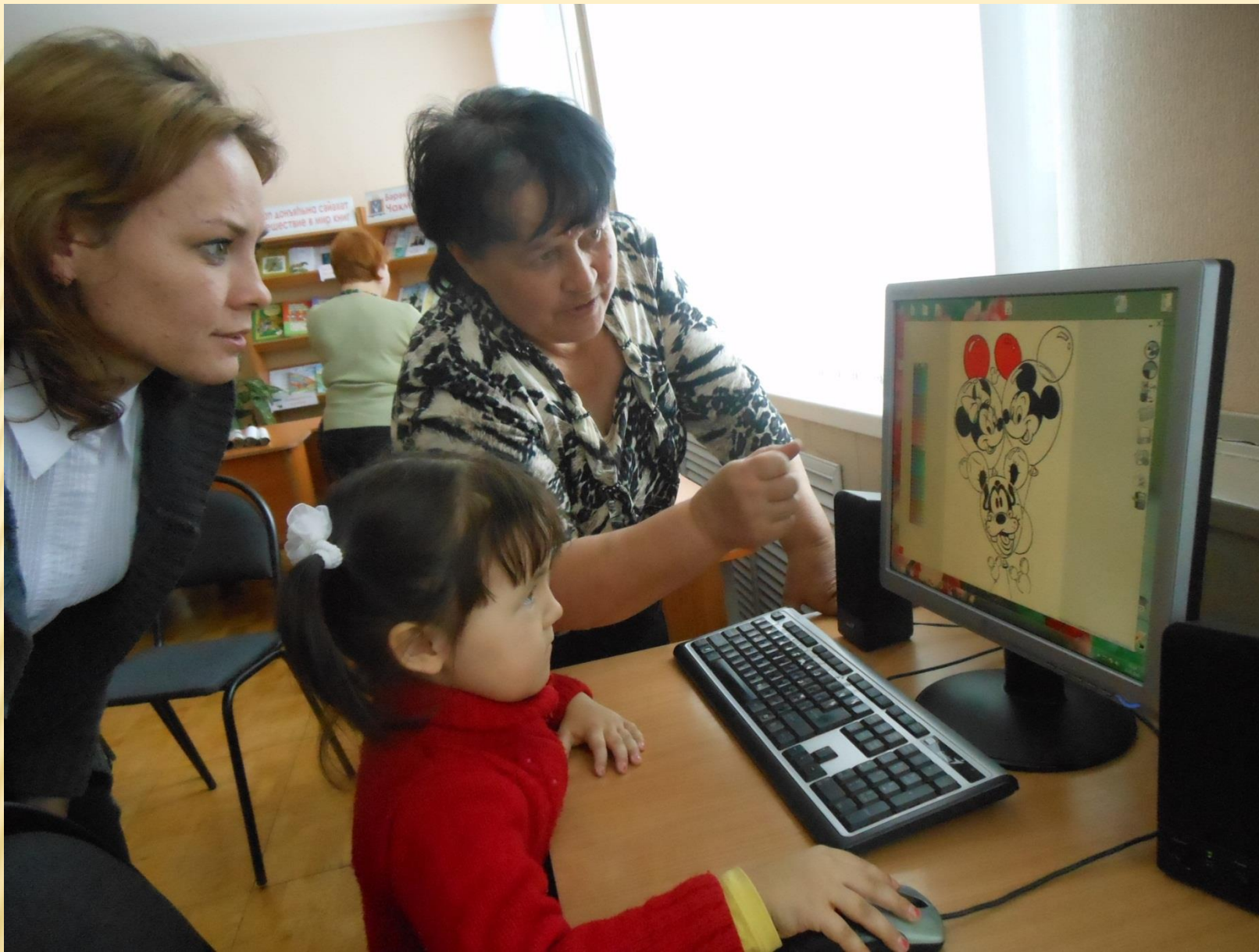
Творческая работа «Разноцветная фантазия»