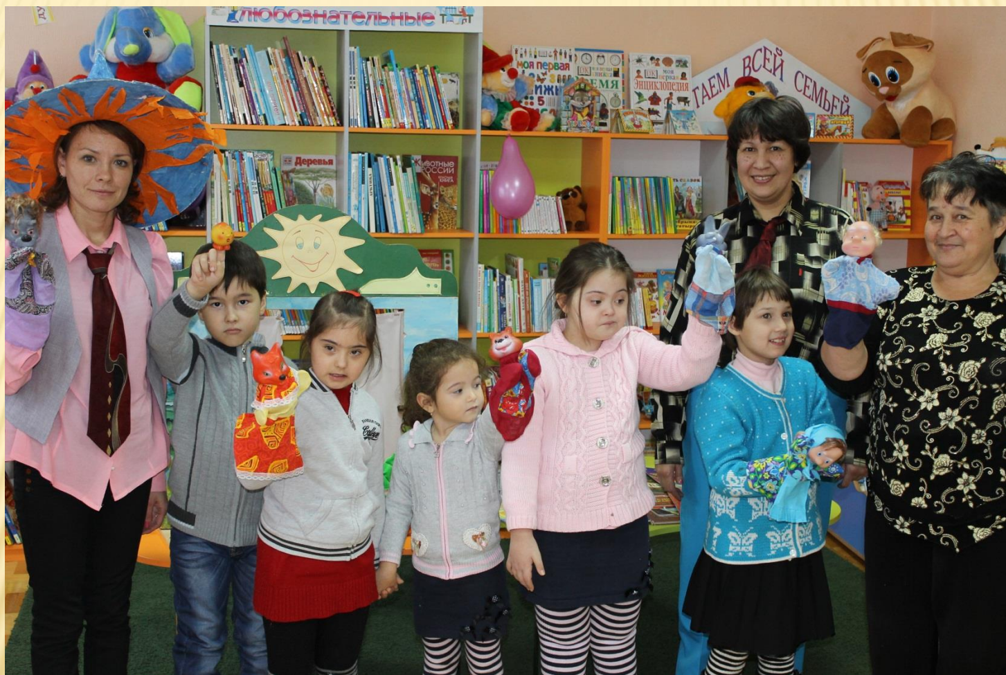
Кукольный театр по любимой сказке «Колобок»